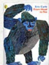
From Head to Toe