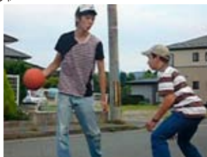
日米スラムダンク☆