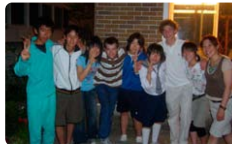
二人の同世代の中学3年生クラス(水曜日)